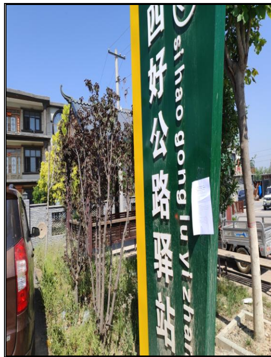
项目厂区出入口附近