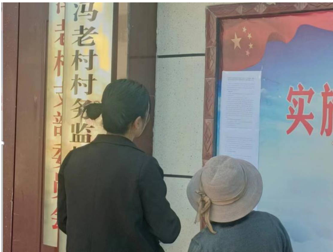
图 3.2-6 现场公示照片（冯老村）