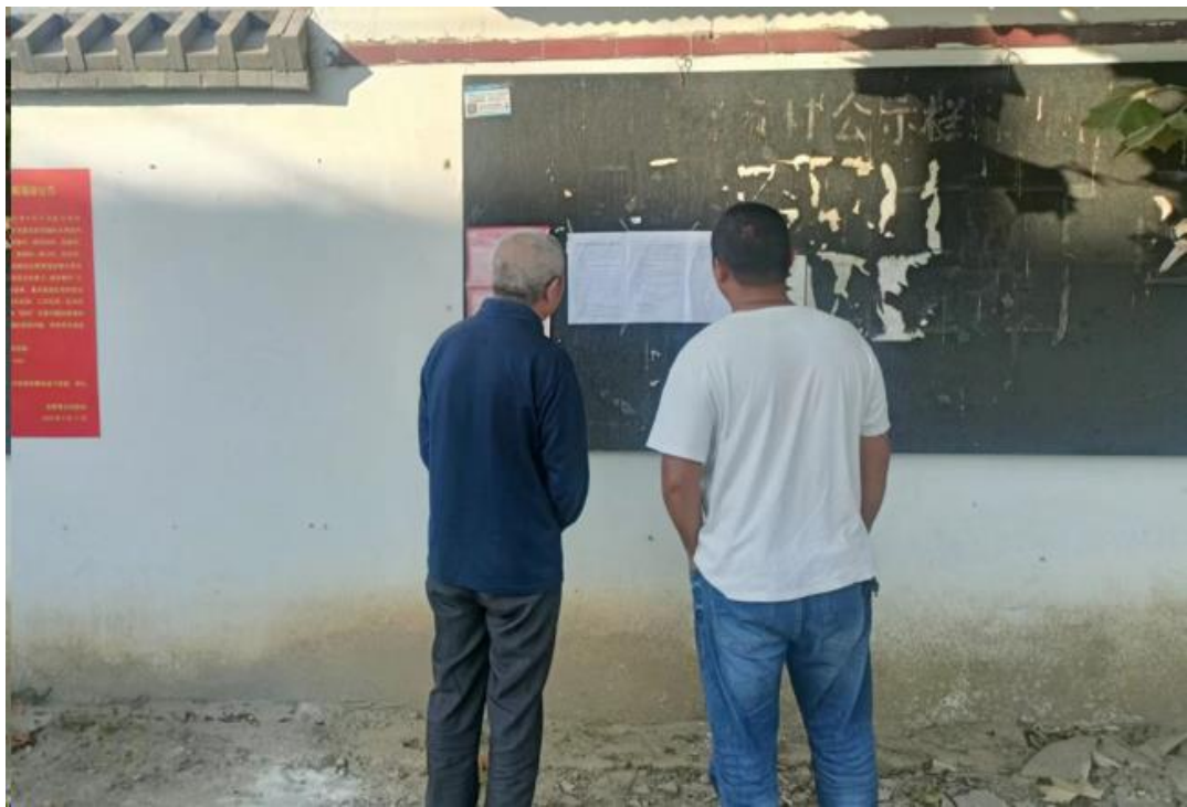
图 3.2-4 现场公示照片（郑王庄）