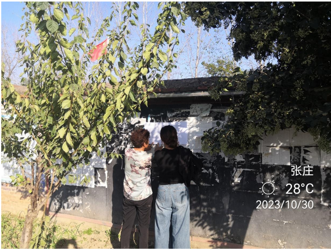
图 3.2-3 现场公示照片（张庄）