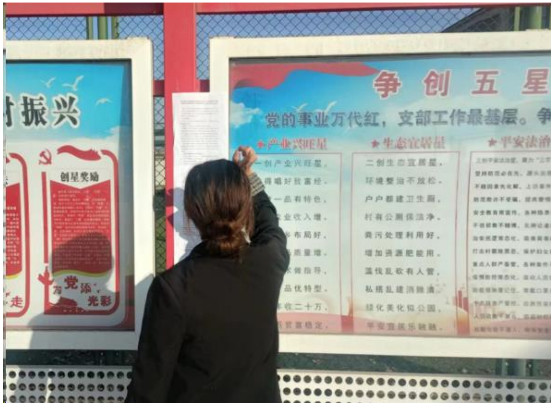
图 3.2-5 现场公示照片（周庄）